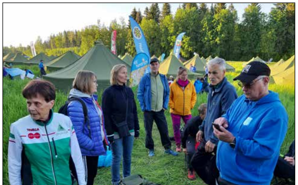
Valmistautumista viestiin Epilän Esan seuraltella ilta-auringon vielä paistaessa.