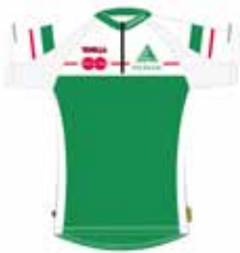
lyhythihainen paita 45€ (- seuratuki 20€)

Asuja voi tiedustella ja varata sähköpostilla osoitteesta petri.hirvonen(at)pispala.net. Muista myös, että kaikkia perusmallisia mustia suunnistus- ja hiihtohousuja sekä sukkia voi ostaa suoraan Noname Storelta Tampereelta Klingendahlilta Epilän Esan alennettuun seurahintaan.