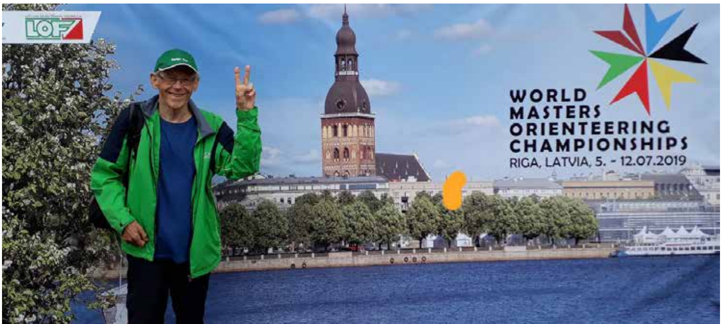
Heikin kisatervehdys Riikasta.