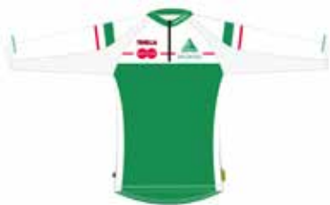
pitkähihainen paita 48€ (- seuratuki 20€)