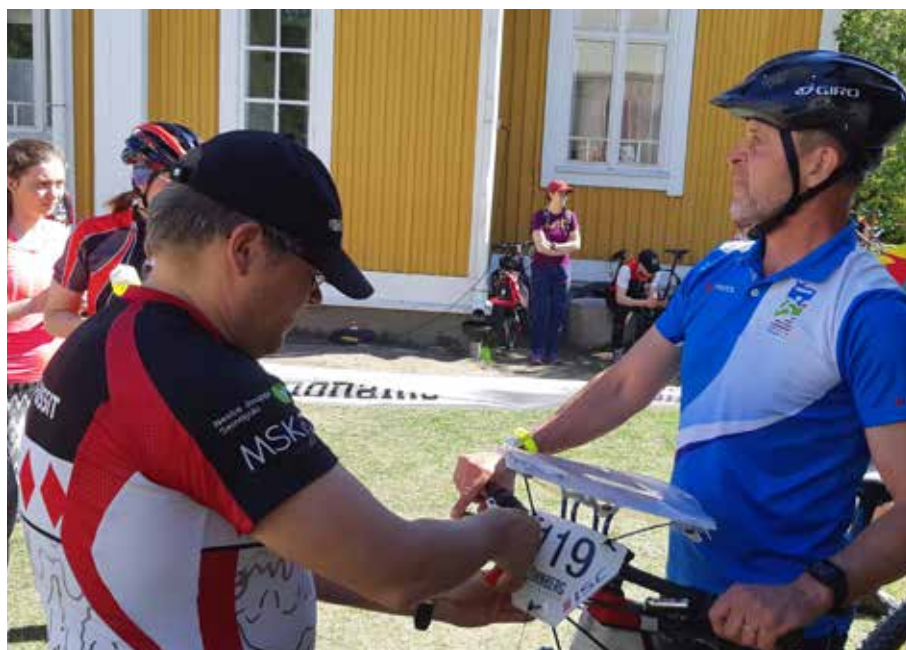
Tapsa maaliintulon jälkeen pyöräsuunnistuksen SM-sprinttaviestissä Seinäjoella.