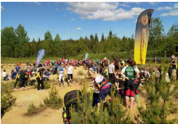
Mukava määrä saatiin väkeä Hepo-ojalle, osallistujia oli yli 350.