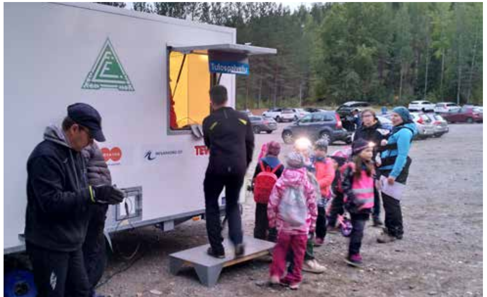
Lapsia lähdössä innolla yösuunnistamaan Lamminpään iltarasteilla 23.9.2019.

Syksyn koululais-suunnistusviikoilla lokakuun alussa tarjosimme viime vuotiseen tapaan koululaisille tarkkuussuun-