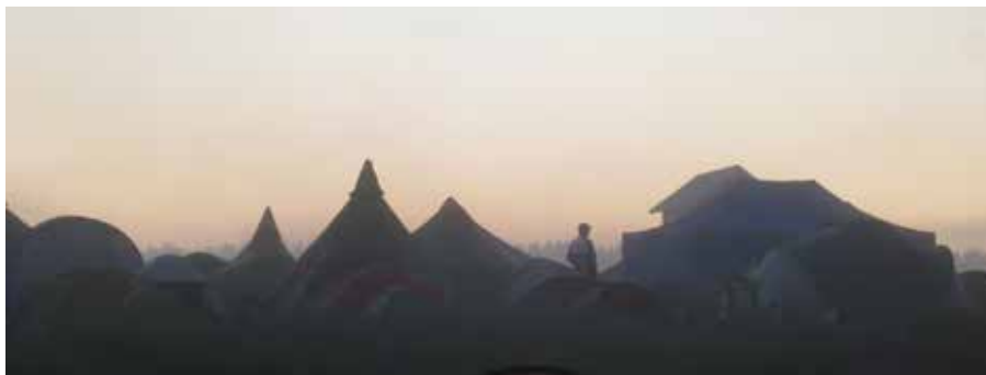
Yön usvaisia hetkiä teltta-alueella Kangasalan Jukolassa...

Kannen kuva: "Yhteistyöllä kaikki sujuu", AM-kisojen talkoissa kesäkuussa.