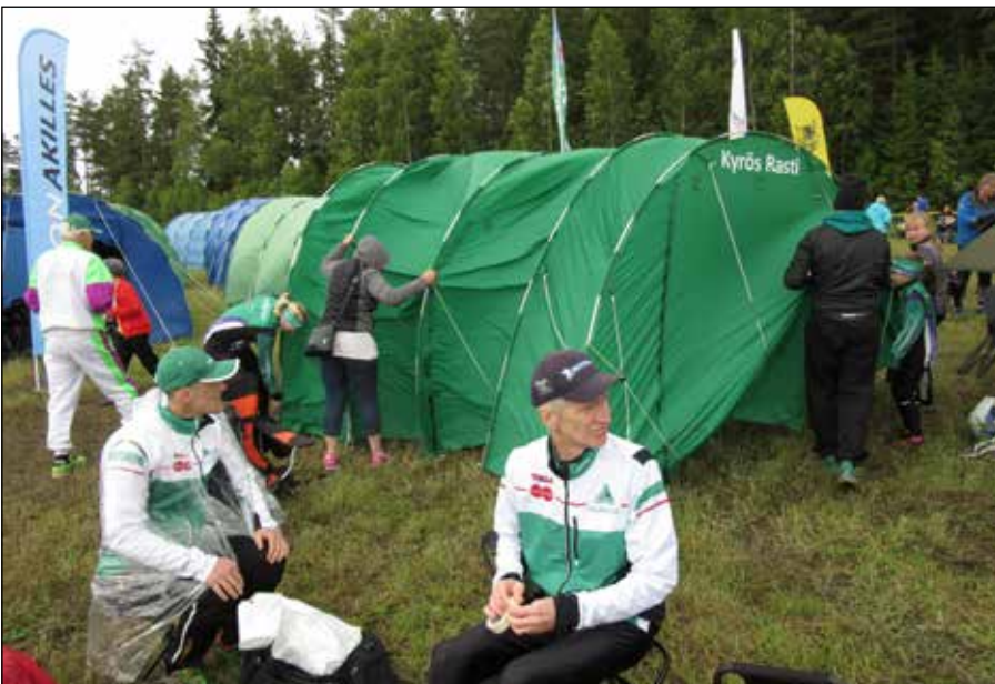
Kyrös-Rastilaiset pystyttävät tuulisuojaa Fin5:llä, mutta Epilän miehiä ei pieni sade haittaa.