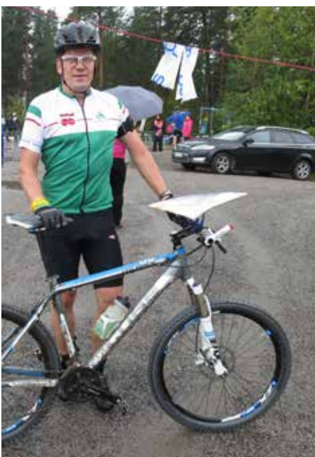
Myös Pj kävi Lohjalla SM-kisoissa, haastavaa oli!