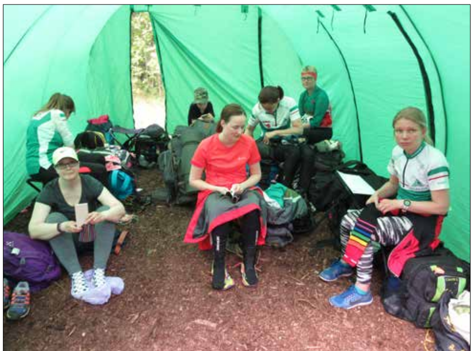
Epilän naiset valmistautumassa Venlojen viestiin tuulisuojateltalla.