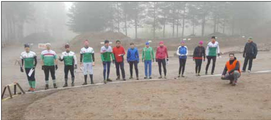
12 rohkeaa Esalaista valmiina seuranmestaruuskisan lähtöön.