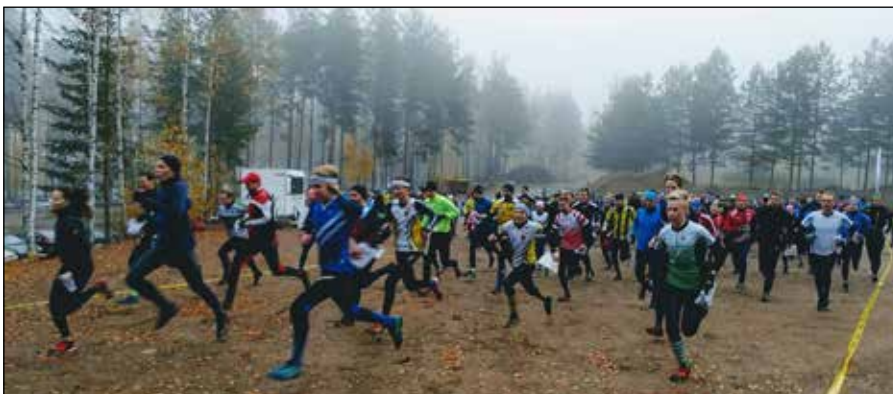
Pillin vihellyksestä suuri joukko suunnistajia kiihdytti kohti Horhan rinteitä.