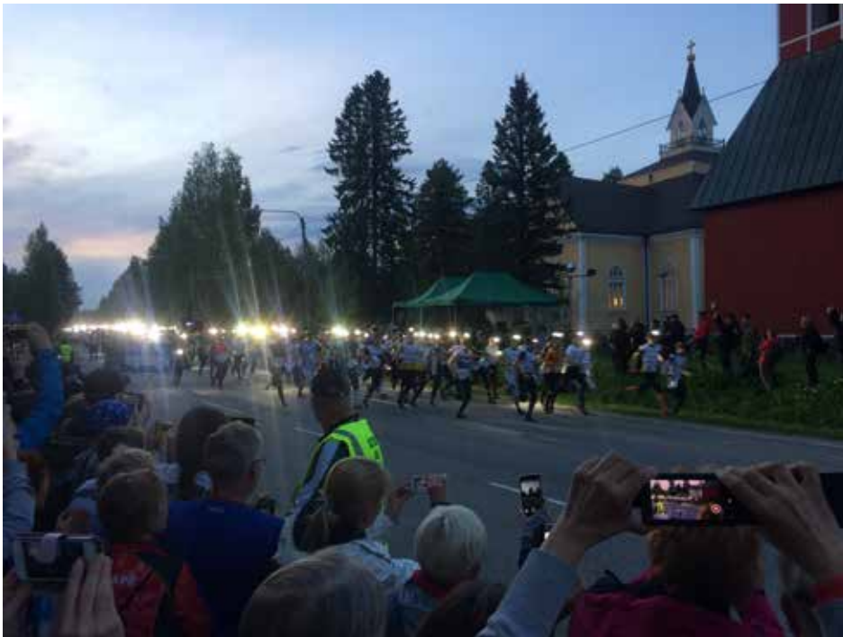
Jukolan lähtöä kirkon edustalla olivat seuraamassa myös presidentti Niinistö ja rouva Haukio.

Joensuun Enossa oli hyvät puitteet Jukolan järjestämiselle. Kilpailukeskus sijaitsi Enon koulukeskuksessa ja lähtö tapahtui kylän raitilta kirkon vierestä. Läheinen Harpatinvaaran mäki-alue oli sekä fyysisesti että suunnistuksellisesti vaativa.